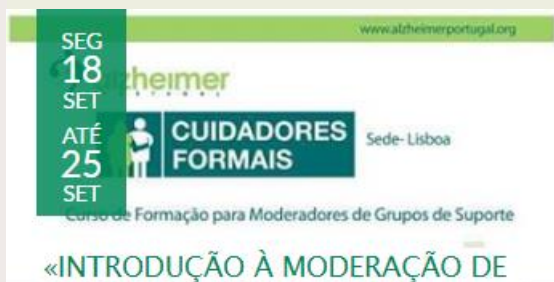
«INTRODUÇÃO À MODERAÇÃO DE GRUPOS DE SUPORTE PARA CUIDADORES»