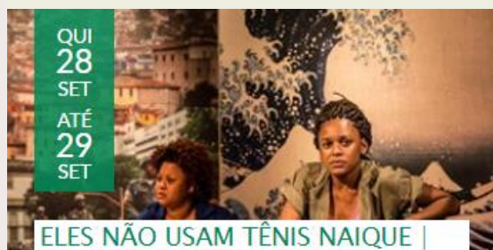
ELES NÃO USAM TÊNIS NAIQUE | CIA MARGINAL