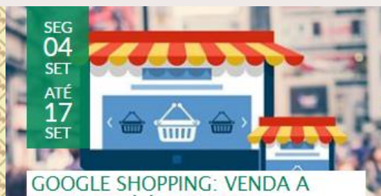
GOOGLE SHOPPING: VENDA À QUEM ESTÁ À PROCURA!