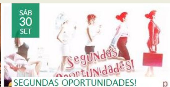
SEGUNDAS OPORTUNIDADES! REENCONTRO COM O EMPREGO