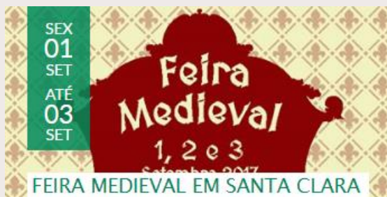
FEIRA MEDIEVAL EM SANTA CLARA