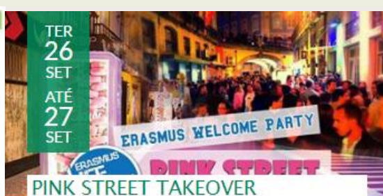
PINK STREET TAKEOVER